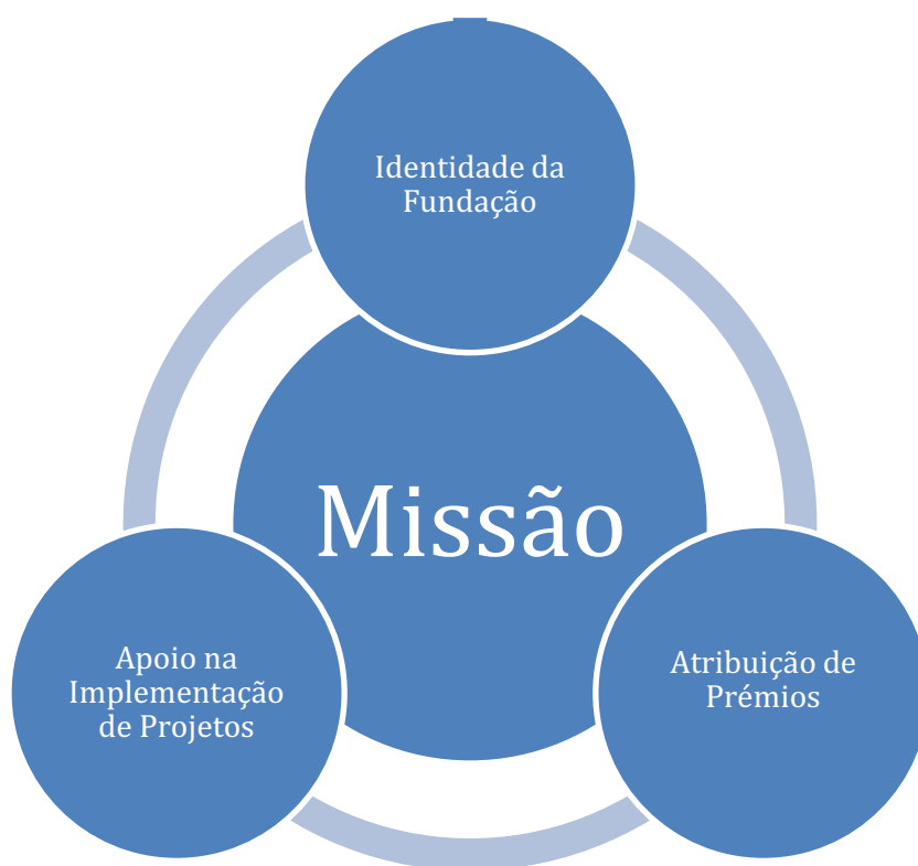
Figura 1 – Eixos de intervenção no âmbito da Missão