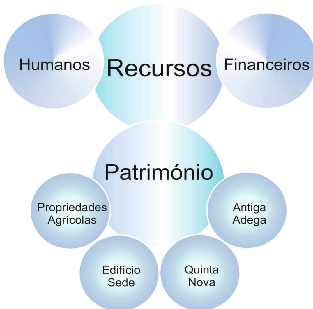
Figura 2 - Eixos de intervenção no âmbito dos Recursos

No âmbito da Gestão de Recursos (patrimonial, humanos e financeiros)