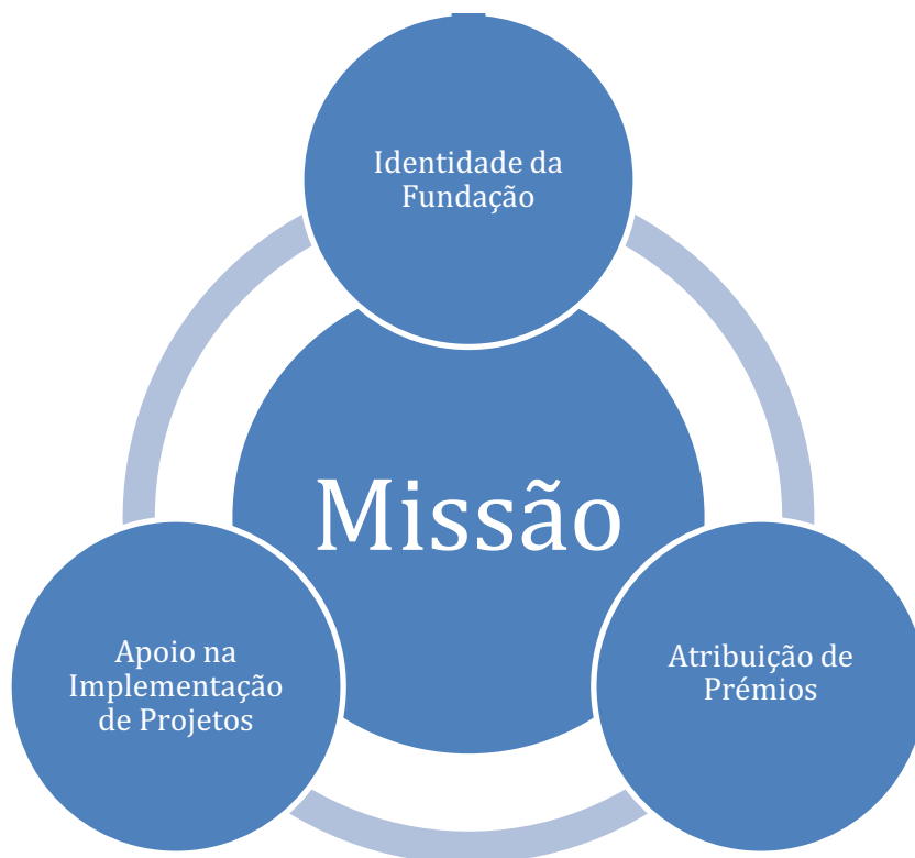
Figura 1 – Eixos de intervenção no âmbito da Missão